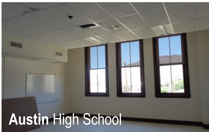
Austin High School

Para más información sobre el proyecto, haga clic aquí .