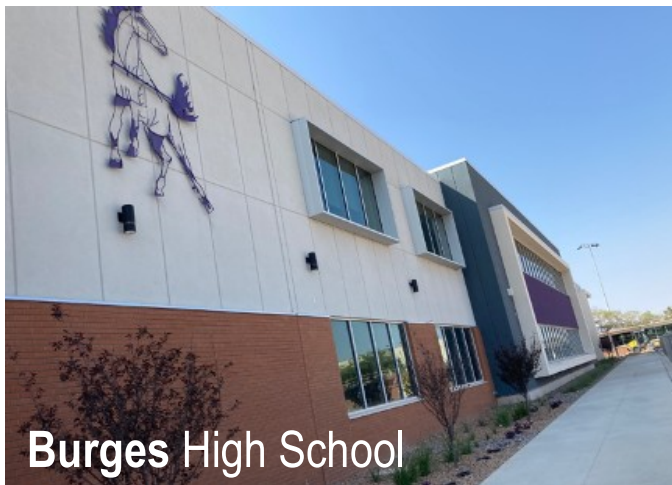
Burges High School

Para más información sobre el proyecto, haga clic aquí .