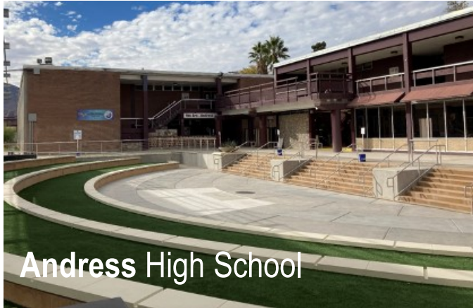
Andress High School