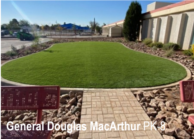
General Douglas MacArthur PK-8